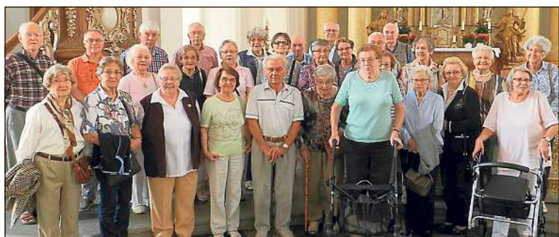
Einen Ausflug zur Jesuitenkirche Maria Immaculata nach Büren haben Senioren aus St. Vit kürzlich unternommen.