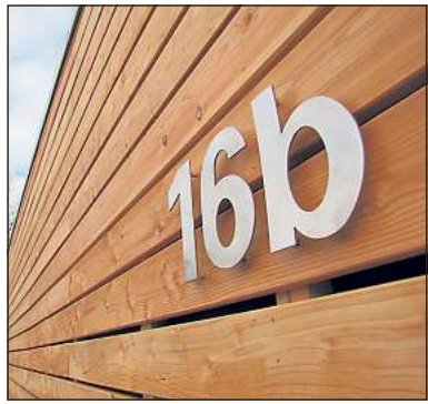
Ein Bretterhaus am Lattenbusch: Nummer 16 b.