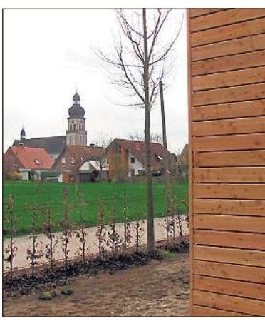
Nah am Dorf: Die St. Viter Kirche haben die Bewohner im Blick.

Dem 16 mal 54 Meter großen Flüchtlingspavillon in St. Vit liegt ein „Familiengrundriss“ zu Grunde. Ziel sei es dabei, teilt die Stadtverwaltung mit, den Bewohnern ein selbst bestimmtes Leben zu ermöglichen. Vorrangig Familien, aber auch Einzelpersonen in Gemeinschaften könnten einquartiert werden. Es gibt Wohn-/Schlafräume, Bäder, Küchenzeilen, einen Hauswirtschafts- sowie einen Technikraum. Für eine Grundausstattung sorgt die Stadt als Eigentümerin und Betreiberin der Einrichtung. Auch Internetanschluss soll es geben. Für die Unterkünfte haben die Bewohner gemäß der städtischen Satzung für Übergangsheime eine Monatsgebühr von 90 Euro zu zahlen.