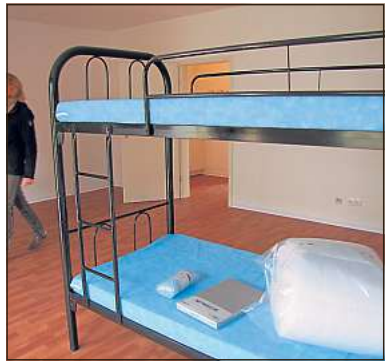
Doppelstöckig: ein Bett in der neuen Flüchtlingsherberge.